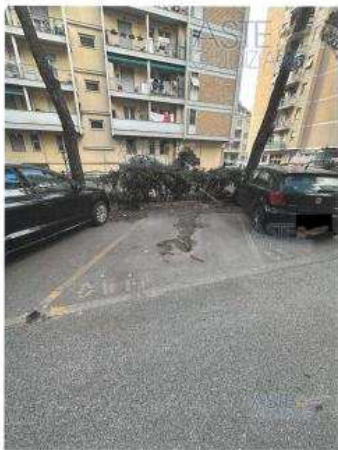
POSTO AUTO D6

www.astegiudiziarie.it GEOM. LUIGI LANERIO - VIA E. ABRILE 10, 1° INT. 10 n. 8 - GENOVA - tel. 010/59498- Riproduzione ufficiale autorizzata dal Tribunale di Genova - 1° ed. 1998 Riproduzione o riproduzione a scopo commerciale - Aut. Min. Giustizia P.O. 21/07/97