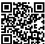
Foto reali Chiudi

Ho due belle fatine al posto delle mani... A Prato Italiana