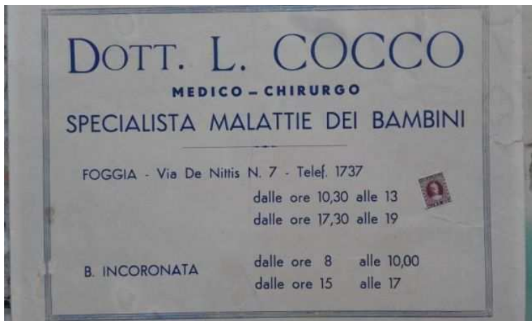
Tabella cartonata medica anni 50 (20 EUR)

Luogo Puglia, Foggia https://www.annunci.it/x-63492-z