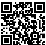
FOTO REALI. NO WHATSAPP