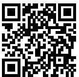
FOTO REALI NO NUMERI ANONIMI GRADITA GENTILEZZA

Non perdere tempo a telefonare per chiedere servizi che esulano dal mero massaggio: rispetta il lavoro altrui ed evita di telefonare per fare altre richieste che otterranno sempre una risposta negativa.