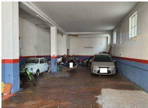
Foto 2: Il garage con accesso dal civico n. 7 della Via Enna – Santa Maria di Licodia (CT) corrispondente al subalterno n. 3

Publicazione ufficiale ad esclusivo uso personale - è vietata ogni ripubblicazione o riproduzione a scopo commerciale - Aut. Min. Giustizia PDG 21/07/09